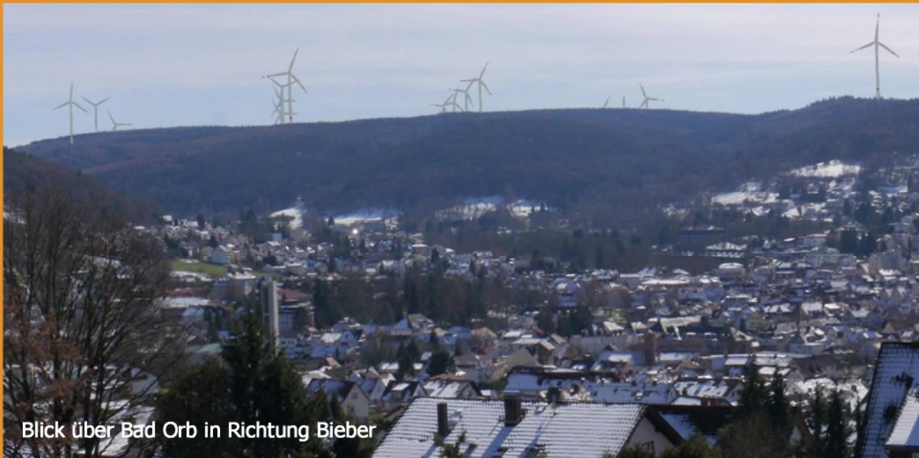
Blick über Bad Orb in Richtung Bieber