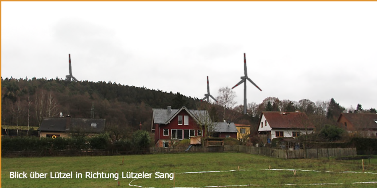
Blick über Lützel in Richtung Lützeler Sang